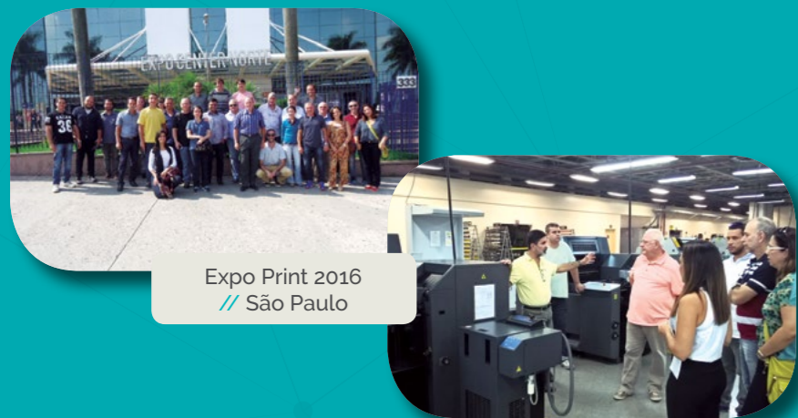
Expo Print 2016 // São Paulo

Oportunidades para os empresários trocarem informações, adquirirem conhecimentos e interagirem com outros agentes da cadeia produtiva.